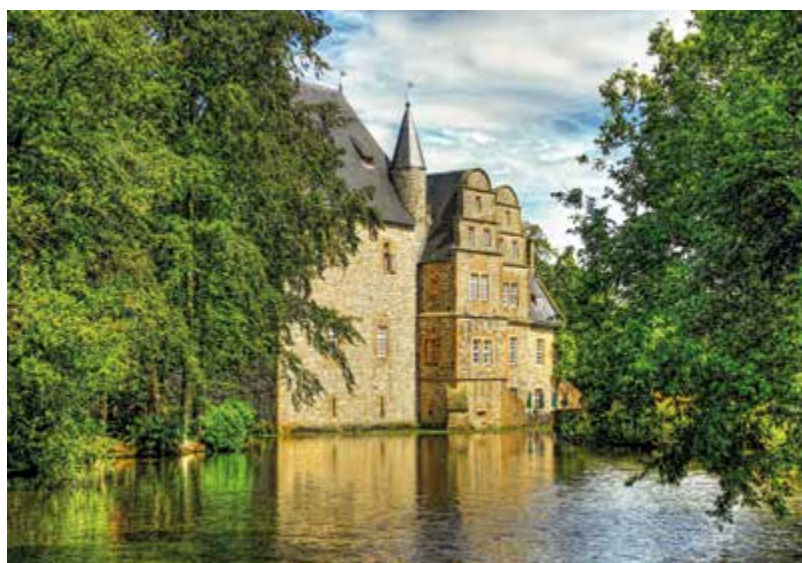
Das Wasserschloss Schelenburg