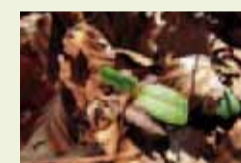
03 | Baumkeimling (im Uhlenhorster Forst bei Mülheim / Ruhr)