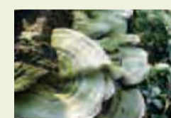
02 | Winterfarben (Baumpilze bei Schloss Rheda; Rheda-Wiedenbrück)