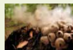
09 | FOTOGRAF: Dietmar Helle Stäubende Bovisten (Dringenberger Wald; Bad Driburg)