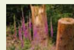
06 | Blühendes Leben (Fingerhut auf einer Kyrill- Windwurffläche bei Altena-Nettenscheid)