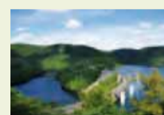
08 | Wald und Wasser im Nationalpark (Urft- talsperre bei Schleiden-Gemünd / Eifel)