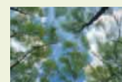
05 Blick in Birkenwipfel (am Mäckinger Bach; Hagen / Westf.)