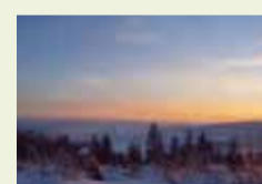
12 | Gute Aussichten (Kyrill-Windwurffläche oberhalb von Balve)