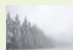
01 | FOTOGRAFIN: Anne Borkenhagen Kahler Asten (bei Winterberg)