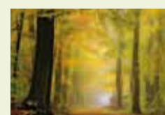
10 | Herbstlaub (Latzebusch in Alpen-Veen)