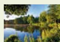
07 | FOTOGRAF: Thomas Brocher Morgenlicht (an der Holzmühle bei Wegberg)