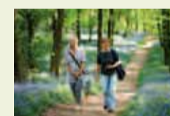
04 | Wald der blauen Blumen (Blüte der wilden Hasenglöckchen bei Hückelhoven-Doveren)