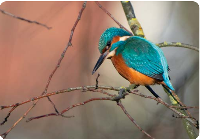
NOVEMBER Eisvogel ( Alcedo atthis ) Aufnahmeort: Detmold Platz 3