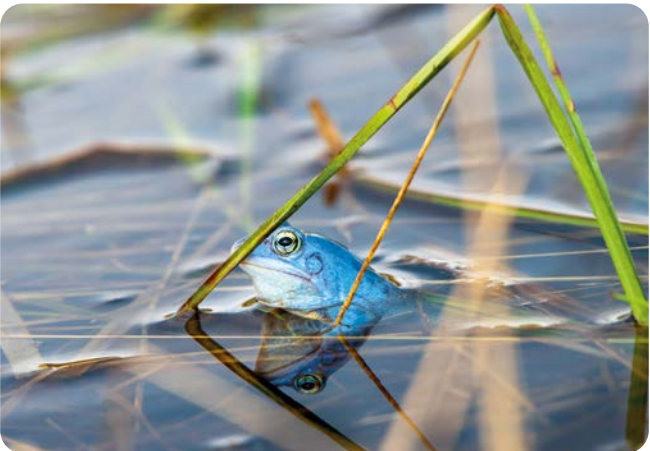
MÄRZ Moorfrosch ( Rana arvalis ) im Großen Torfmoor Aufnahmeort: Lübbecke Platz 4