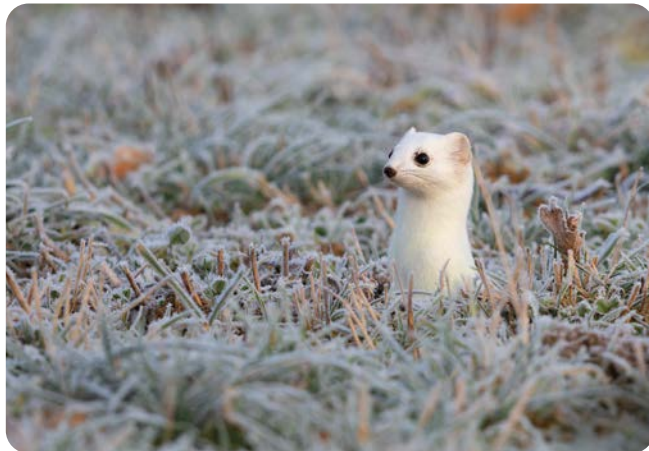
JANUAR Hermelin ( Mustela erminea ) im Winterfell Aufnahmeort: Neuenrade Platz 1