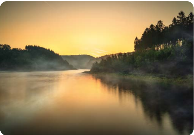
SEPTEMBER Hasper Talsperre Aufnahmeort: Hagen Platz 4