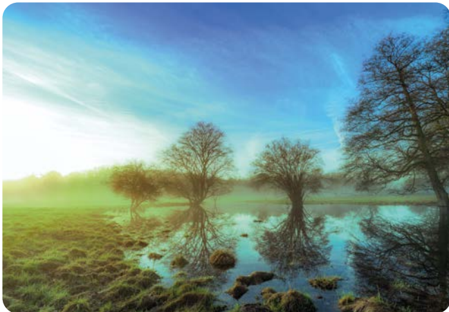
FEBRUAR Aggerauen Aufnahmeort: Troisdorf Platz 4