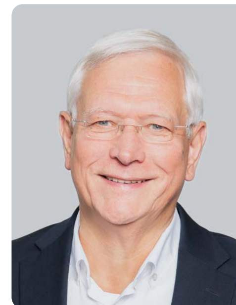
Oliver Krischer Minister für Umwelt, Naturschutz und Verkehr des Landes Nordrhein-Westfalen