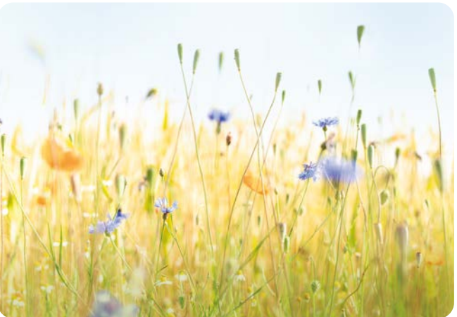
JUNI Wildblumen in den Rieselfeldern Münster Aufnahmeort: Münster Platz 4