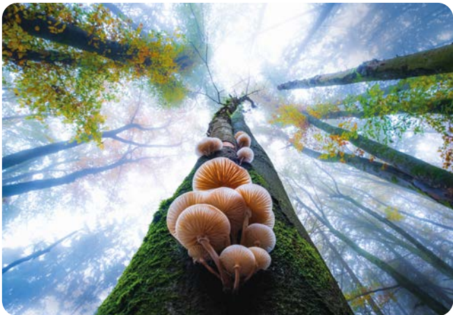
OKTOBER Buchen-Schleimröbling ( Mucidula mucida ) Aufnahmeort: Freudenberg Platz 2