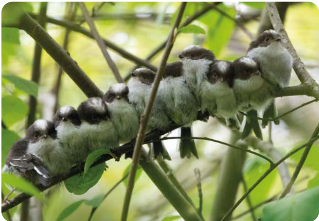
APRIL Junge Schwanzmeisen ( Aegithalos caudatus ) Aufnahmeort: Möhnesee Platz 4