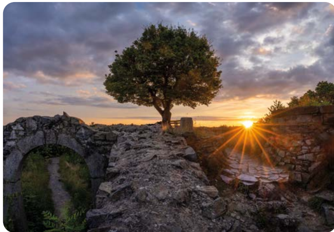
JULI Ruine Löwenburg Aufnahmeort: Bad Honnef Platz 4