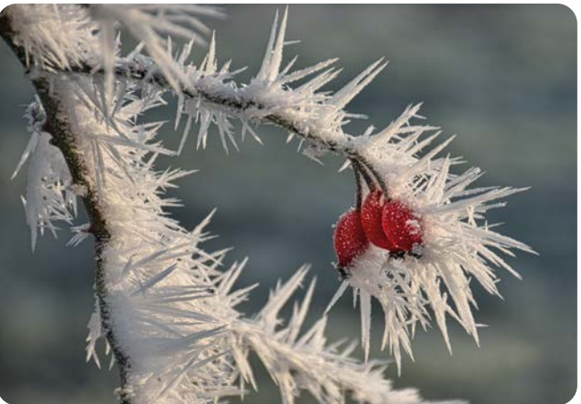
DEZEMBER Hagebutten Aufnahmeort: Rahden Platz 4