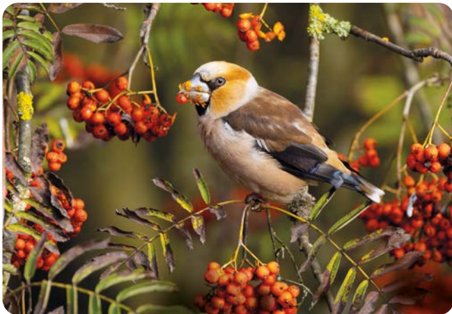
AUGUST Kernbeißer ( Coccothraustes coccothraustes ) Aufnahmeort: Lindlar Platz 4