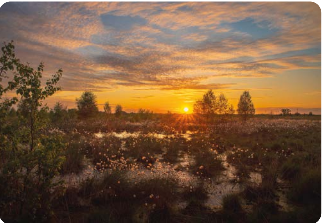
MAI Wollgrasblüte im Oppenweher Moor Aufnahmeort: Stembede Platz 4