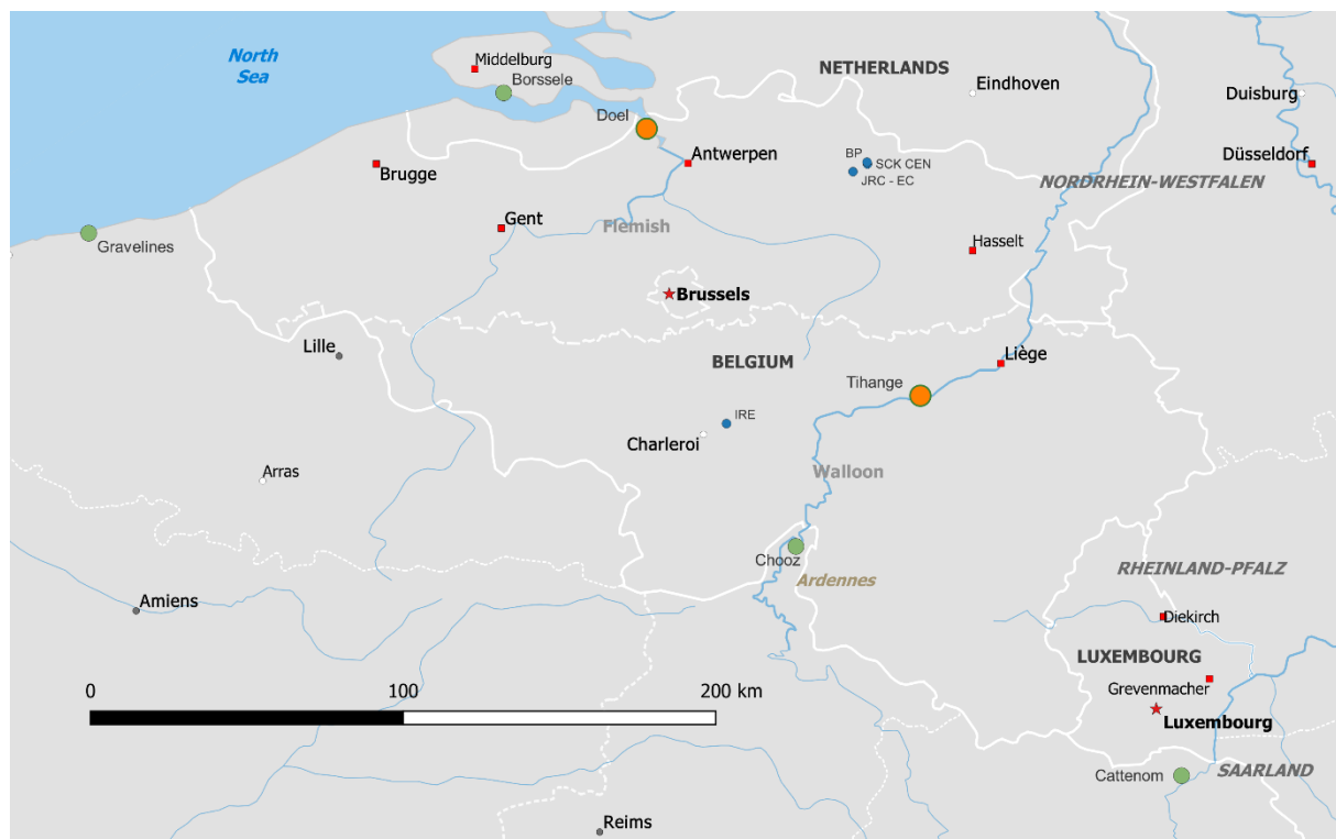
Abbildung 1: Standorte der Kernkraftwerke Doel und Tihange (orange), der Kernkraftwerke an den belgischen Grenzen (grün) und anderer Nuklearanlagen der Klasse 1 in Belgien (blau)

Doel 4 und Tihange 3 gehören zum Standort des Kernkraftwerks Doel (KKW Doel) an der Schelde, Scheldemolenstraat, Haven 1800, 9130 Doel, bzw. zum Standort des Kernkraftwerks Tihange (Centrale Nucléaire de Tihange, KKW Tihange) an der Maas, Avenue de l'Industrie 1, 4500 Huy (Abbildung 1), und werden von Electrabel SA betrieben.